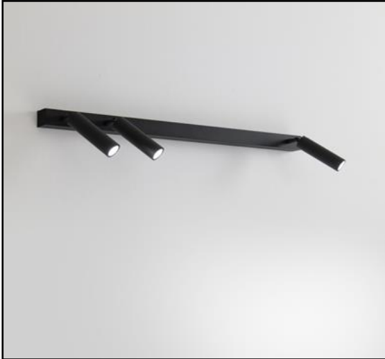
Attenzione: l'immagine raffigura il prodotto con spot LEO MINI

Apparecchio da parete/plafone completo di tre spot LEO piccolissimo orientabili sui due assi con LED ad alta efficienza, realizzato in alluminio estruso verniciato a polvere epossipoliestere. Il grado di protezione contro la penetrazione di polvere, corpi solidi e liquidi è IP40. Apparecchio completo di terminali di chiusura. Driver inclusi.